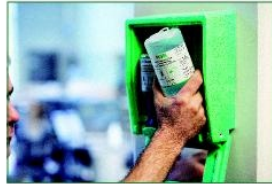
İstasyondan göz duşunu alın.