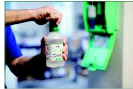
Kapağı oklar yönünde çevirerek kırın ve göz duşu kullanılmaya hazır.