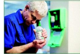
Kafanızı öne doğru eyerek göz duşunu kullanabilirsiniz.